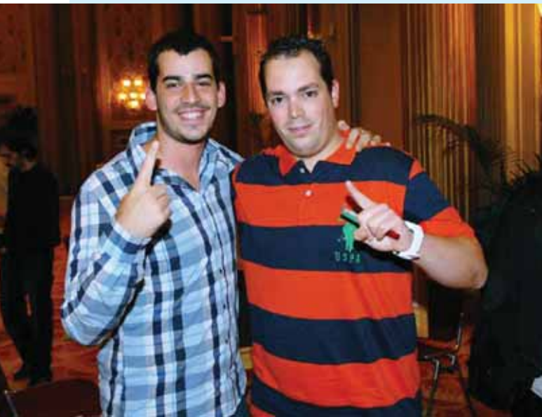
אלופי הקוונדיש בטקס הסיום